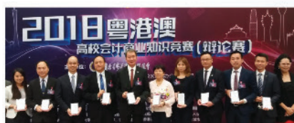
2018年9月27日，本會獲廣東省粵港澳合作促進會邀請贊助高校會計商業知識競賽，本會會長及秘書長亦應邀出席為比賽作評審委員。