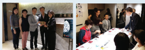
2018年10月20日，本會邀請富銜珠寶行為會員安排“Diamonds, Quality and Value” 鑽石鑒賞講座及誕生石寶石飾物工作坊。