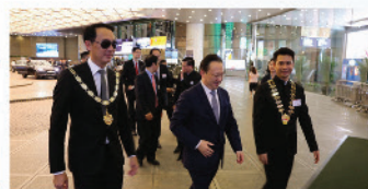
2018年9月4日，本會與香港會計師公會於香港會議展覽中心合辦香港會計界慶祝六十九周年國慶聯歡晚會。