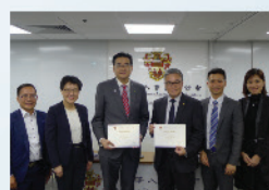
2018年10月12日，本會舉辦Green Talk，邀請到機電工程署助理署長潘國英工程師及世界綠色組織行政總裁余遠聘博士為大家講解綠色城市及氣候變化。當晚，本會會長更分享實踐綠色辦公室的成果。