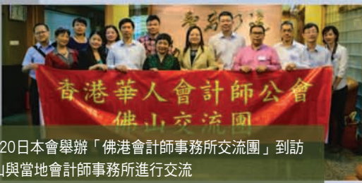
6月20日本會舉辦「佛港會計師事務所交流團」到訪佛山與當地會計師事務所進行交流