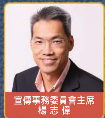
宣傳事務委員會主席 楊志偉