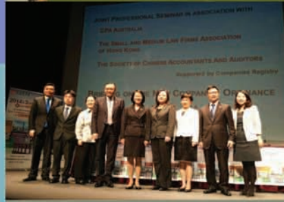
4月23日本會與公司註冊處、澳洲會計師公會及香港中小型律師協會合辦“Joint Professional Seminar: Briefing on the New Companies Ordinance”