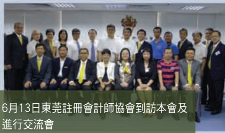
6月13日東莞註冊會計師協會到訪本會及進行交流會