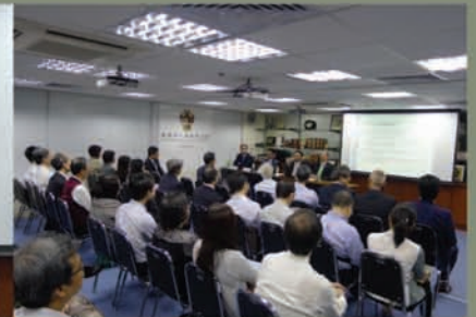
4月29日就“Succession Planning: a “Perfect Storm” 議題舉行會員論壇