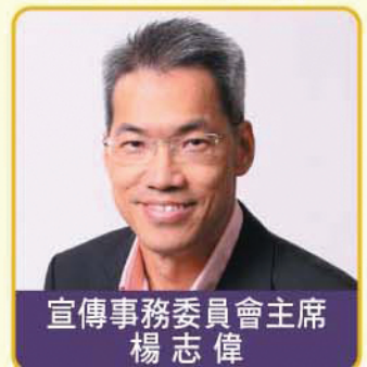
宣傳事務委員會主席 楊志偉