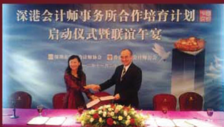
深港會計師事務所合作培育計劃啟動儀式暨聯誼午餐在11月23日於深圳舉行