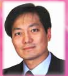
宣傳事務委員會主席周振強先生