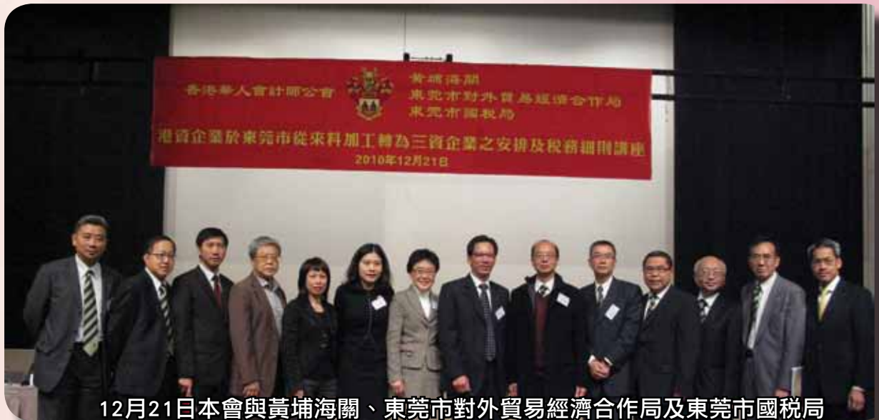
12月21日本會與黃埔海關、東莞市對外貿易經濟合作局及東莞市國稅局合辦舉行“港資企業於東莞市從來料加工轉為三資企業之安排及稅務細則”之講座