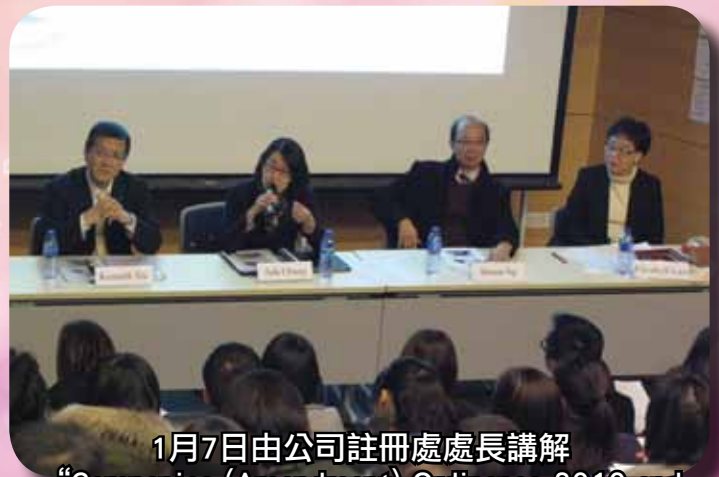
1月7日由公司註冊處處長講解“Companies (Amendment) Ordinance 2010 and Electronic Incorporation of Companies”