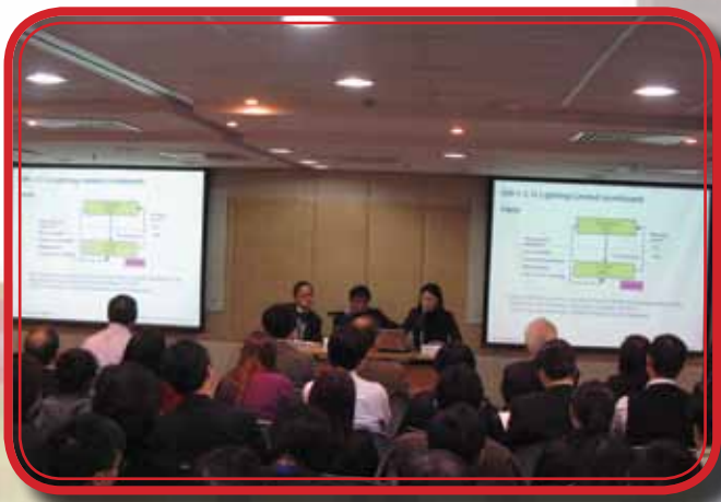
12月15日由德勤·關黃陳方會計師行代表講解 “Hong Kong Profits Tax Update”