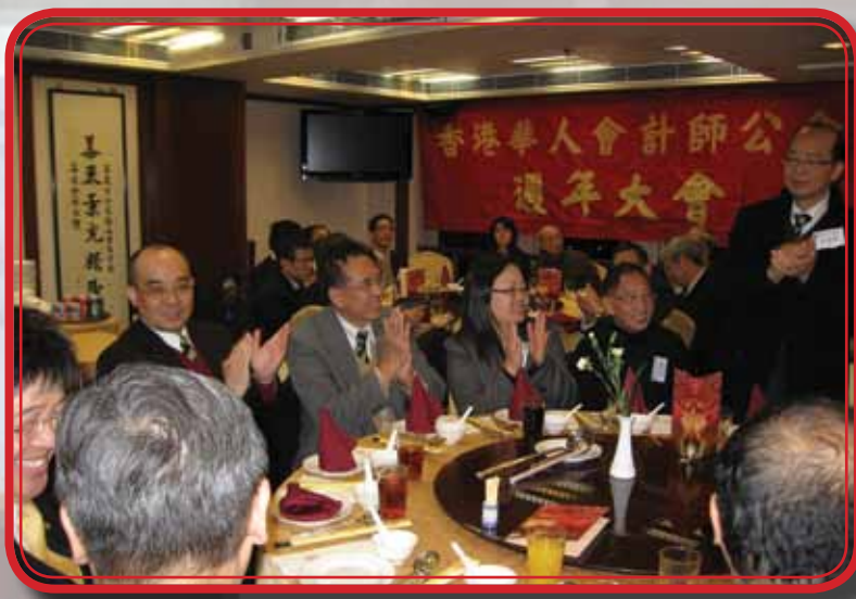
12月16日舉行本會一年一度的週年大會