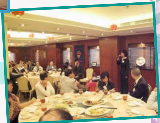
5月27日的會員午餐例會 “Professional Surveyors' Services”