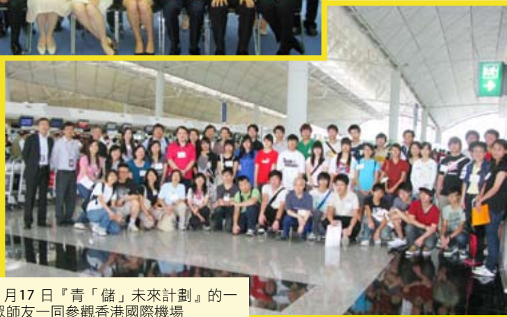
7月17日『青「儲」未來計劃』的一眾師友一同參觀香港國際機場