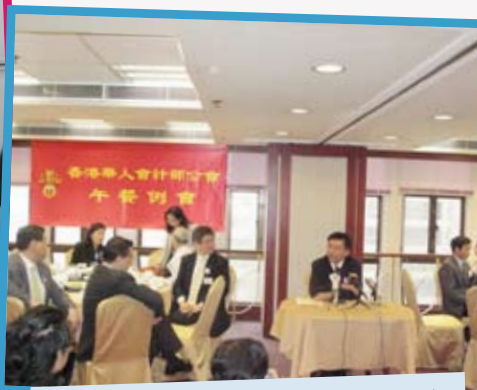
6月10日的會員午餐例會邀請了- 財經及庫務局局長陳家強教授講解：“香港金融服務業之監管新方向及對會計界的影響”