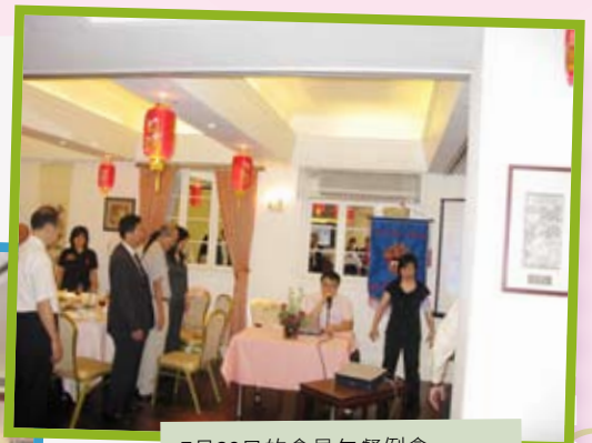
7月29日的會員午餐例會 — “專業人士如何舒減壓力”