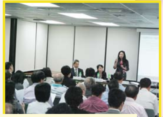
8月31日由安永代表講解“Acquiring the essential know-how to conduct financial due diligence and common financial and tax issues for PRC targets”