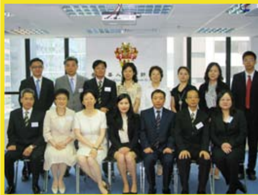
7月12日日本會理事與中國注冊會計師協會代表合照