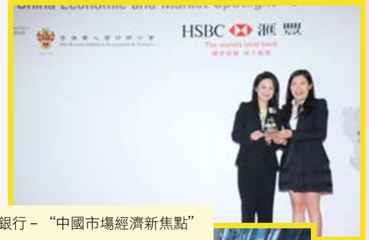
9月7日匯豐銀行 - “中國市場經濟新焦點”