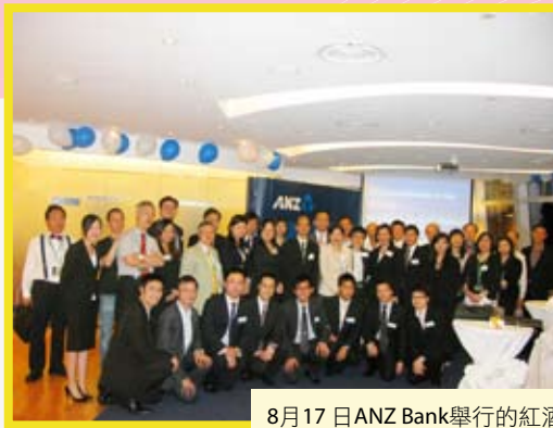
8月17日 ANZ Bank舉行的紅酒試飲