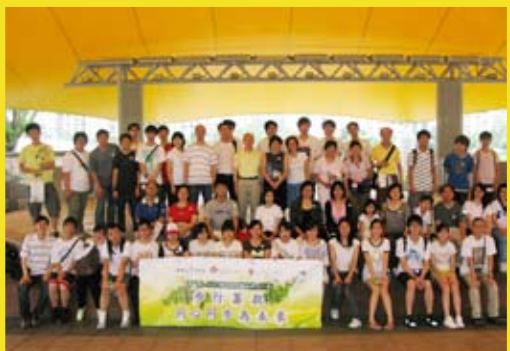
2010年6月20日(星期日)舉行『步行籌款 - 同心同步為未來』籌款活動