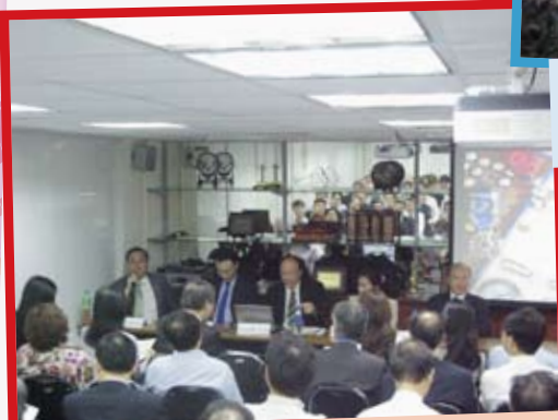
5月24之會員論壇討論 “Hong Kong CPA Practice : Transfer, Merger and Acquisition”