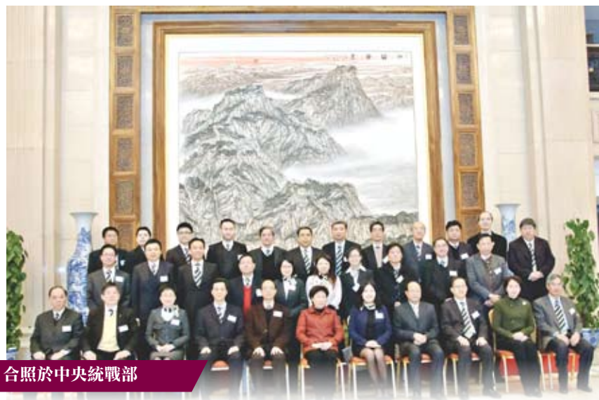
合照於中央統戰部