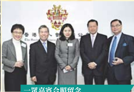
一眾嘉賓合照留念