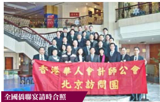
全國僑聯宴請時合照