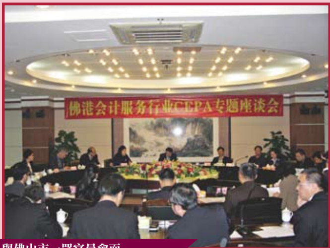
與佛山市一眾官員會面

香港華人會計師公會多年來與廣東省各城市進行互訪及交流，使兩地業界加深認識。今年本會理事會及會員一行約二十五人於11月25及26日前往東莞及佛山進行了為期兩天的交流，拜訪了兩地市政府、財政部、稅局等部門，並與當地會計師會面及就雙方於合作空間上作出探討。是次拜訪除獲得東莞市政府宴請及贊助酒店住宿外，亦分別得到東莞市注冊會計師協會，佛山市財政局及佛山市會計學會設宴款待。