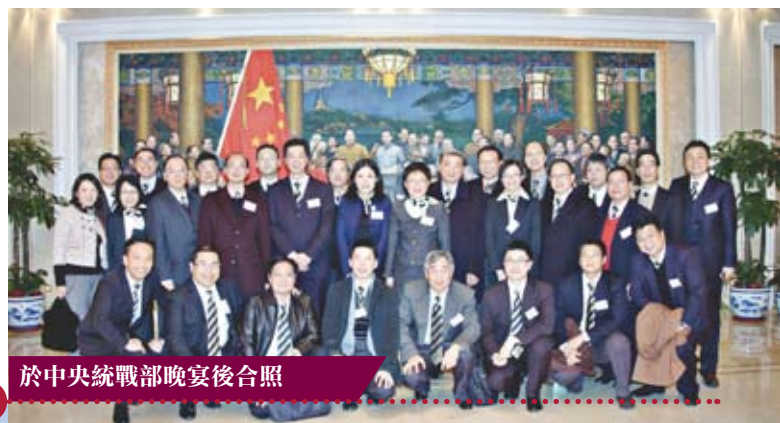
於中央統戰部晚宴後合照