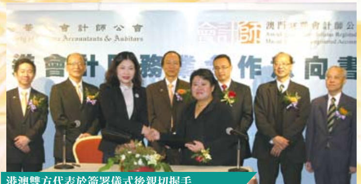
港澳雙方代表於簽署儀式後親切握手