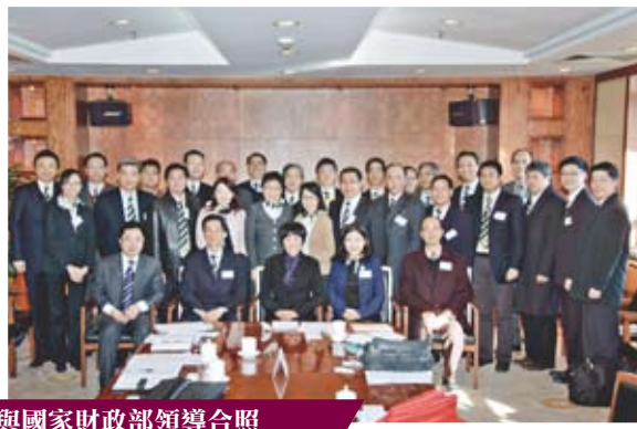
與國家財政部領導合照