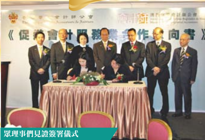
眾理事們見證簽署儀式