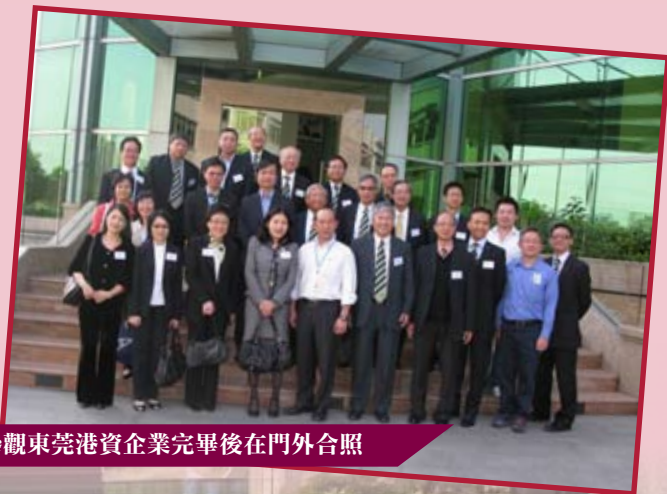
參觀東莞港資企業完畢後在門外合照

除拜訪官方機構外，當局亦安排了多個觀光活動，包括遊覽當地著名景區東平新城、南風古灶及千燈湖金融新區，考察團成員更在南方古灶即場制作的「華師」陶瓷花瓶上簽名留念，實地感受佛山千年的文化魅力和現代發展。