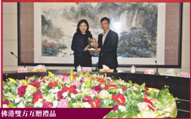
佛港雙方互贈禮品