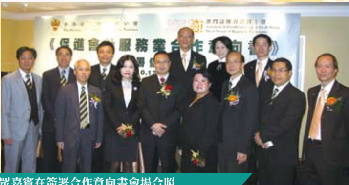
眾嘉賓在簽署合作意向書會場合照