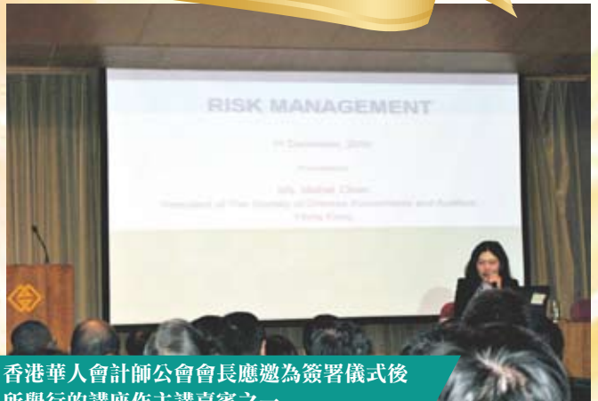
香港華人會計師公會會長應邀為簽署儀式後所舉行的講座作主講嘉賓之一