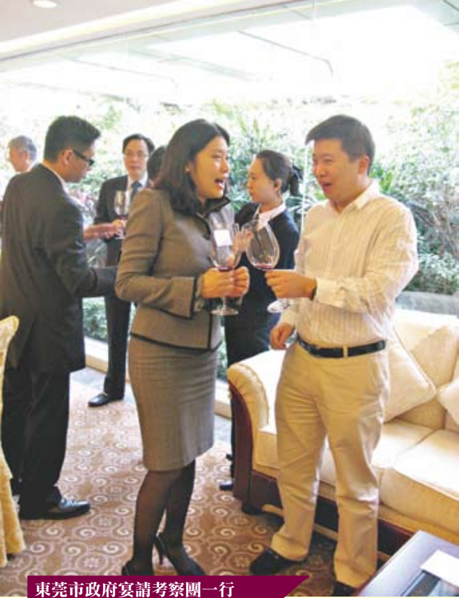
東莞市政府宴請考察團一行