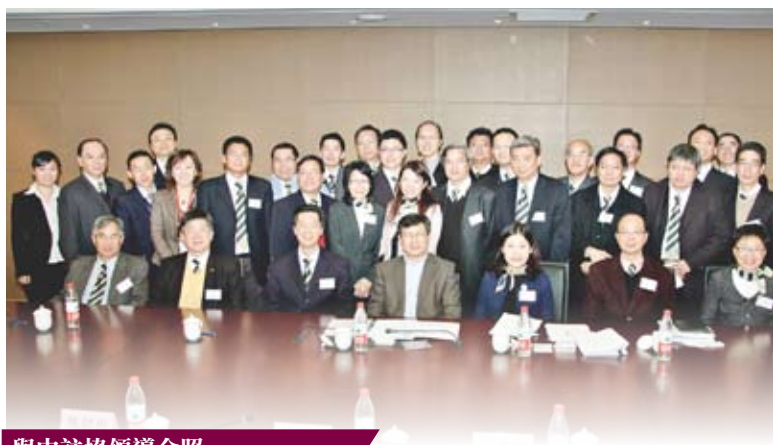
與中註協領導合照