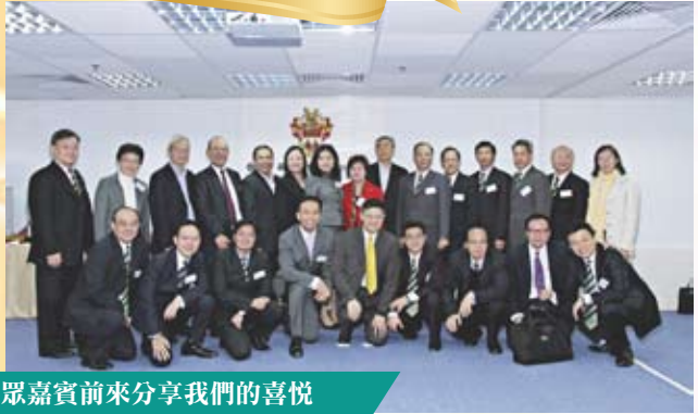
眾嘉賓前來分享我們的喜悅