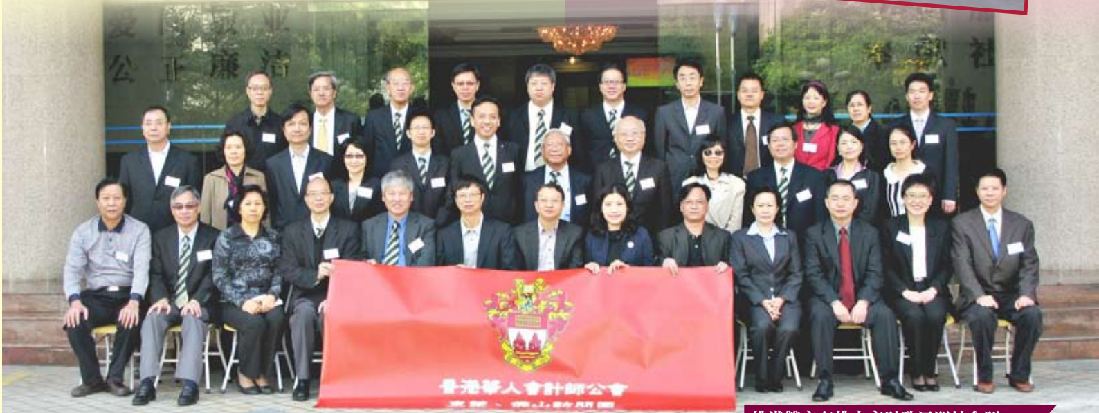
佛港雙方在佛山市財政局門外合照