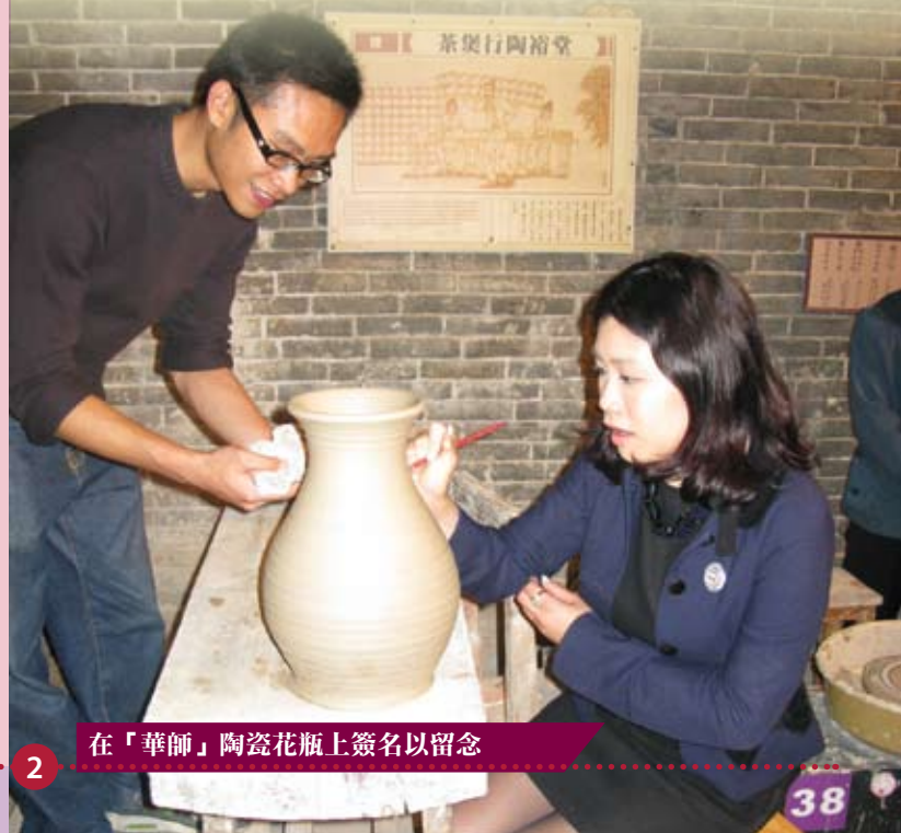
在「華師」陶瓷花瓶上簽名以留念

午膳過後，考察團在東莞市政府官員陪同下，參觀了東莞港資企業「龍昌國際控股有限公司」，聽取有關人員簡介此電子玩具廠的業務研發，團員對此企業的新產品深感興趣，期間踴躍發問，講解員亦一一詳細解答。