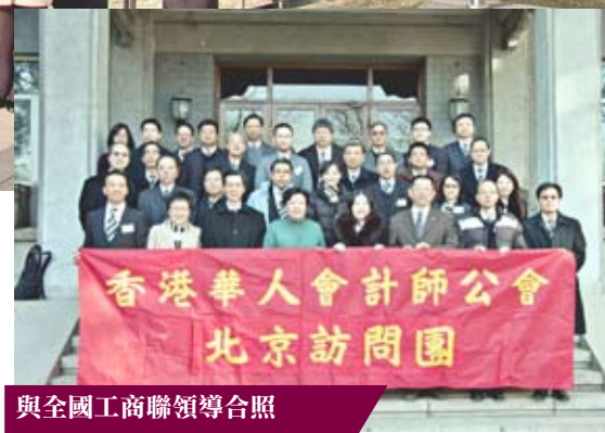
與全國工商聯領導合照