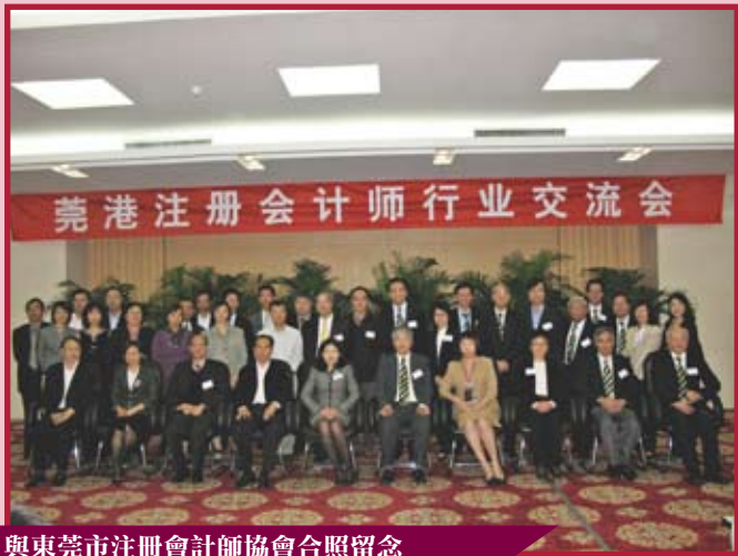
與東莞市注冊會計師協會合照留念