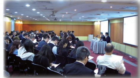
2009年11月30日由柯伍陳律師事務所講解 “Legal update on shareholder disputes”