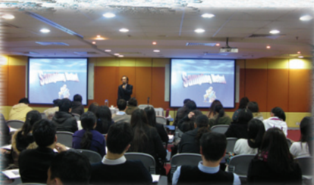
2010年1月7、9、14及16日舉行 Audit Junior 課程