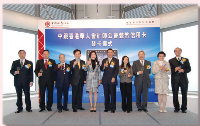
禮嘉賓舉杯，預祝「中銀香港華人會計師公會雙幣信用卡」發卡完滿成功