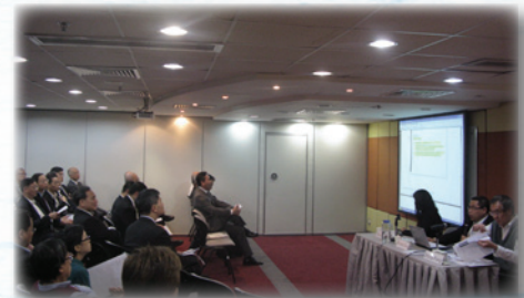
2010年2月10日舉行的會員論壇，討論“Consultation Paper on Proposed Changes to the Practising Certificate”(A revision to the consultation paper January 2009)