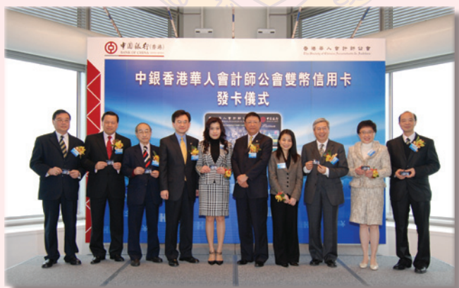
嘉賓持個人「中銀香港華人會計師公會雙幣信用卡」合照