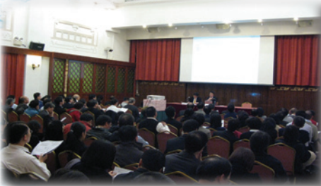
2009年11月23日由柯伍陳律師事務所講解 “Insolvency update on powers and works of liquidators”