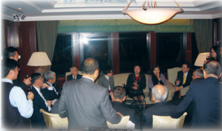
2009年12月16日稅務局局長劉麥懿明女士榮休晚宴