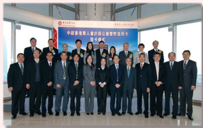
本會理事獲邀與眾主禮嘉賓拍照留念