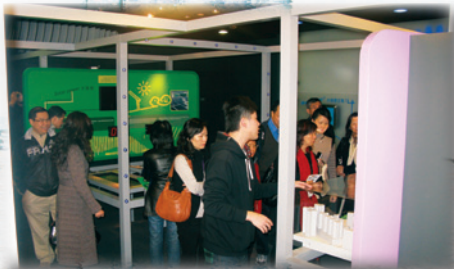
2010年1月9日本會與女會計師協會及其他友會 一同參觀機電工程署和匠智會