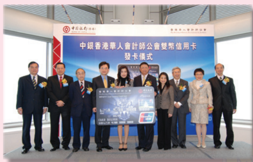
各主禮嘉賓持「中銀香港華人會計師公會雙幣信用卡」模型合照

多年來，本會會員為促進香港及內地的經濟發展，繁榮穩定，經常要往返內地，使用大量人民幣進行消費，造成諸多不便；為滿足這需求，擁有一張認受性高、獨特性之雙幣信用卡將大大為中港兩地會計師業務及交易結算提供便利，改善貨幣兌換風險，亦增加中港兩地生意發展。