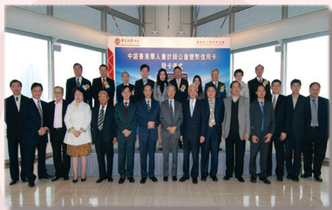
本會會員獲邀與各主禮嘉賓合照