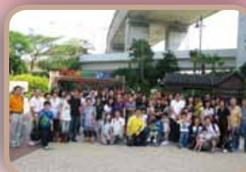
10月18日城門谷噴霧公園、挪亞方舟逍遙一天團