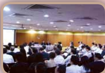
9月10日由永利行估值顧問有限公司講解 "Key to M&A : The Value, Price and Cost in Acquisition"