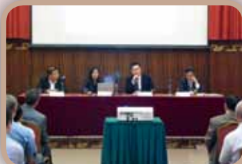
10月27日 由世邦魏理事及丁何關陳會計師行講解 1.Valuation of Share Option & 2. Major Amendments of HKFRS2 Share Based Payment (Revised July 2009)" 研討會