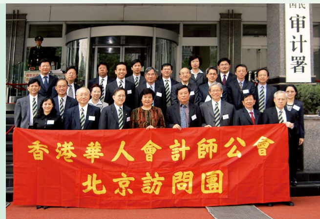
訪京團拜訪國家審計署