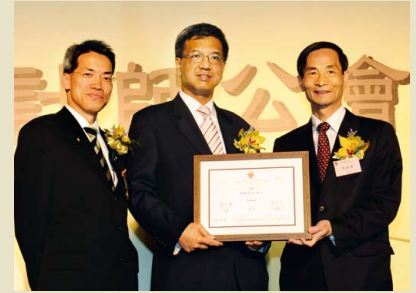
審計署鄧國斌署長