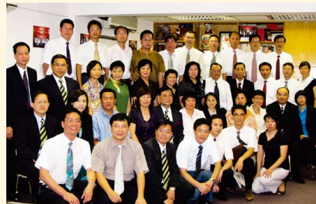
江門會計師拜訪華師