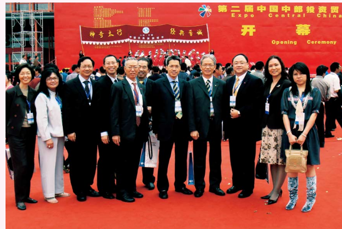
會長出席中國中部投資貿易博覽會