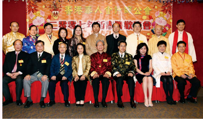
2007年理事會於新春聯歡會合照

會員及同業在艱苦的日子裡都不忘回歸十年的大好日子，本會除了舉辦新春聯歡晚會與會員共慶丁亥年的來臨，本年再與香港會計師公會合辦【香港會計師界慶祝58週年國慶暨香港回歸十週年聯歡晚會】。本年的協辦及贊助機構更增加到十七個會計專業團體。近600位嘉賓會員共敘一堂，分享典禮的歡愉。