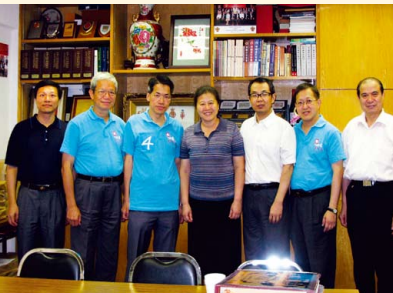
廣東審計師拜訪華師