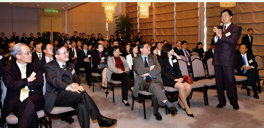
恆生銀行與本會合辦活動