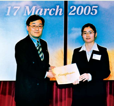
會長頒發獎學金給城市大學學生