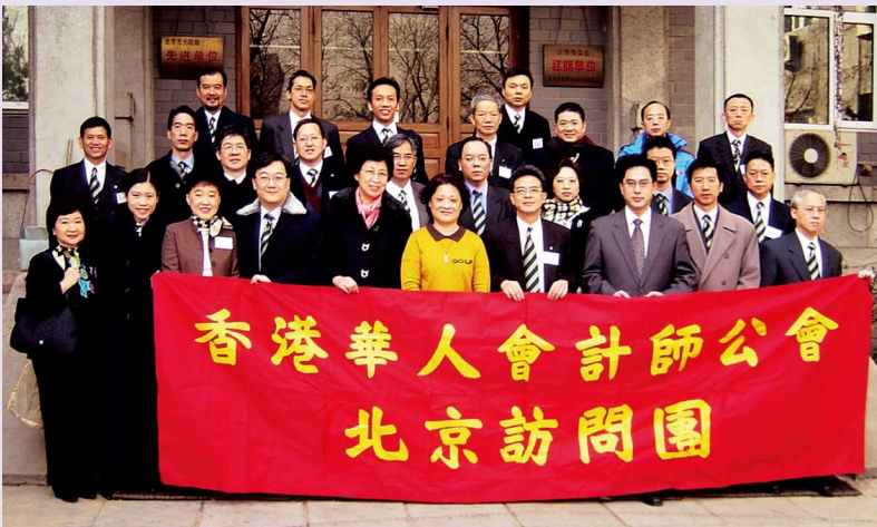
訪京團拜訪全國工商聯