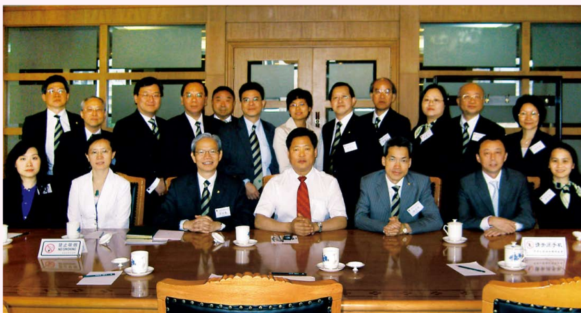
拜訪國家財政部與劉玉廷司長合照