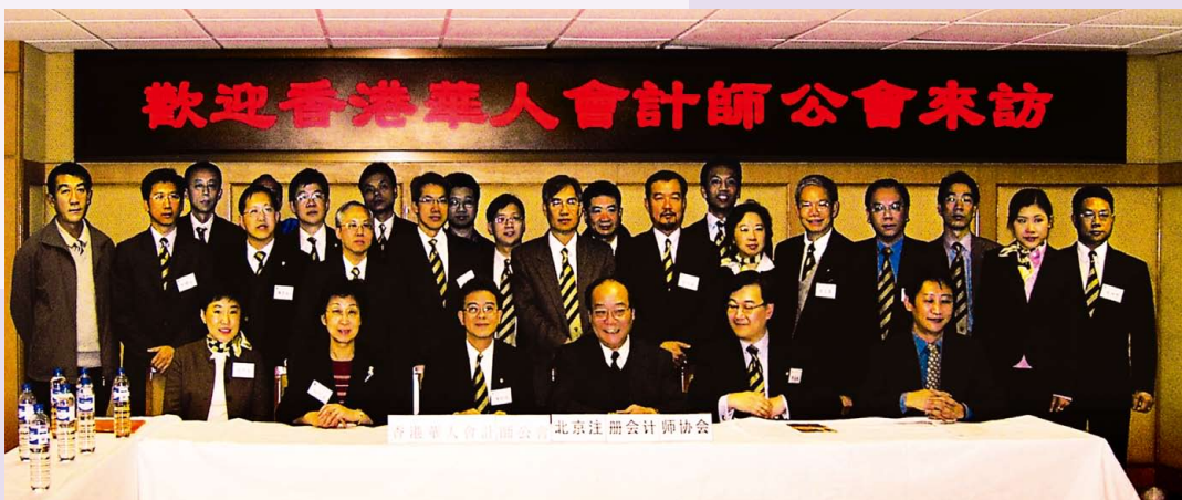
訪京團拜訪北京註冊會計師協會