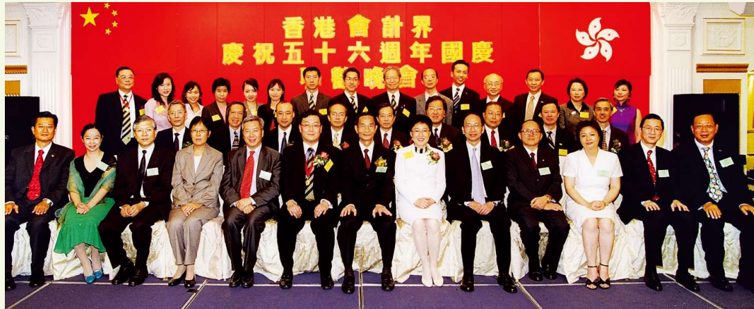
國慶嘉賓及理事合照