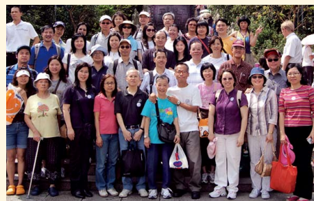
大嶼山昂平360寶蓮寺齋宴團