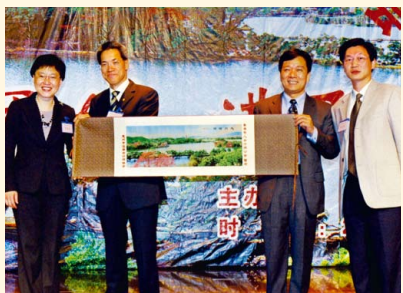
惠州市註冊會計師聯誼晚會