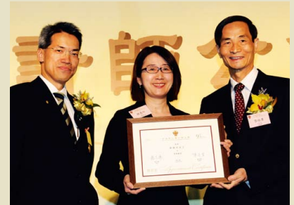
公司註冊處鍾麗玲處長