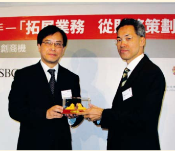
滙豐銀行午餐例會