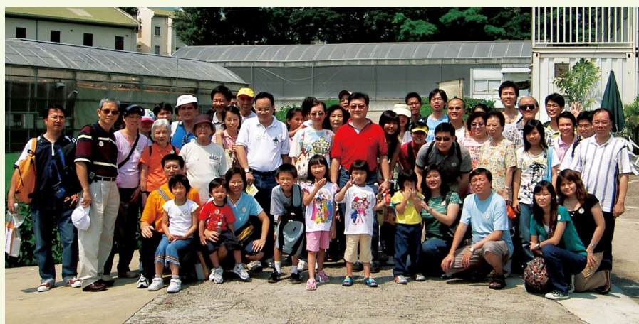
會友及家屬踴躍參加本會活動 - 花香農莊