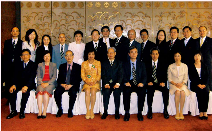
理事會與香港稅務局周年聚會與劉麥懿明局長合照