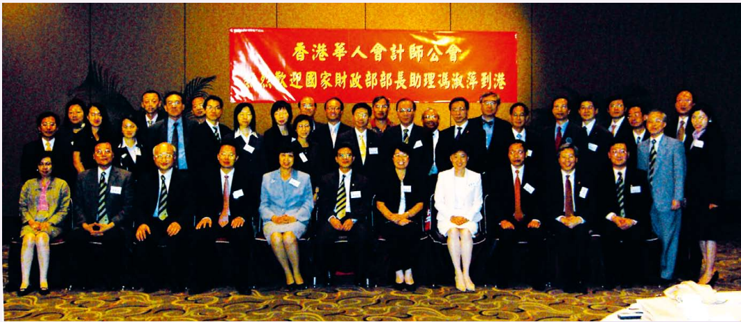
國家財政部部長助理馮淑萍女士蒞臨指導