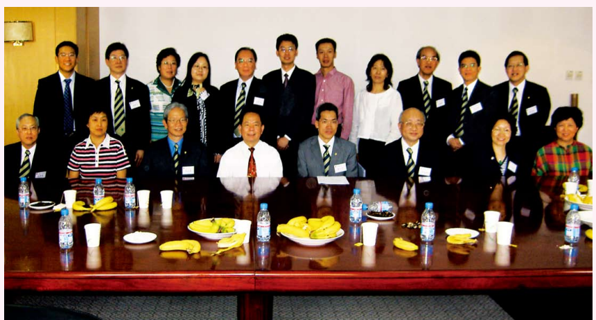
拜訪天津註冊會計師協會並與當地會計師事務所交流