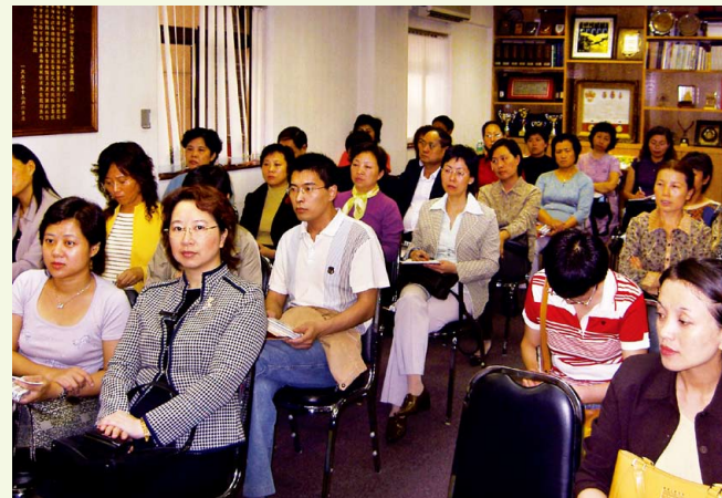
中國南方機車集團財務人員到本會交流