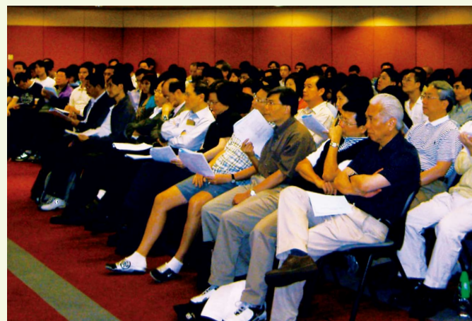
會員參加本會培訓