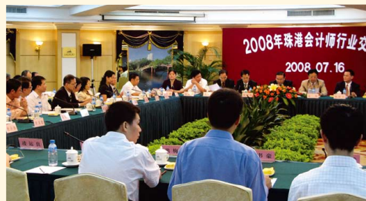
珠海及香港會計師行業交流會