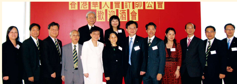
中銀香港為本會主辦之歡迎酒會