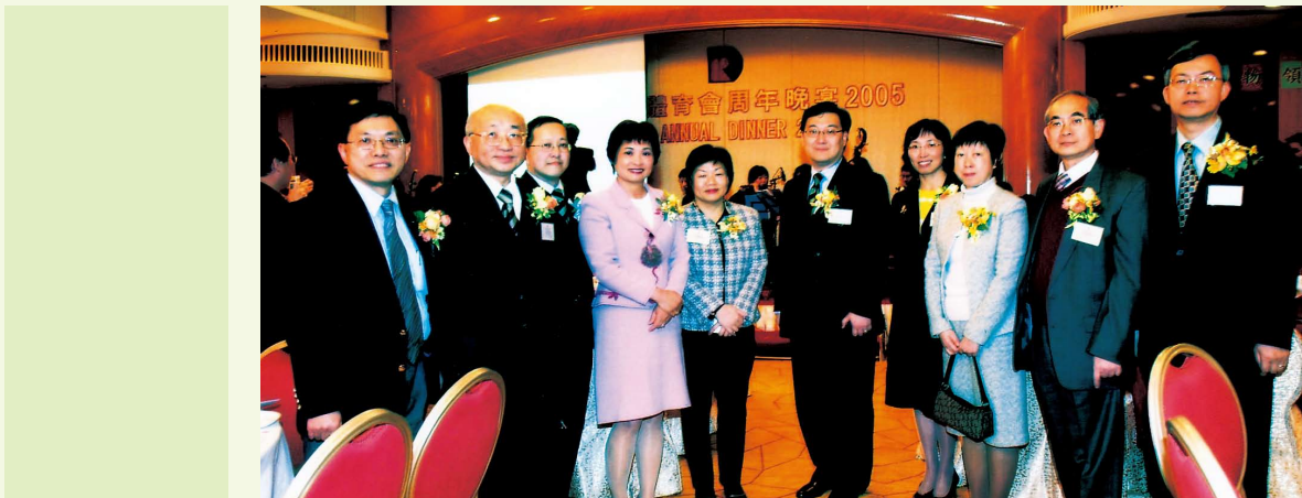
出席香港稅務局體育會周年晚會