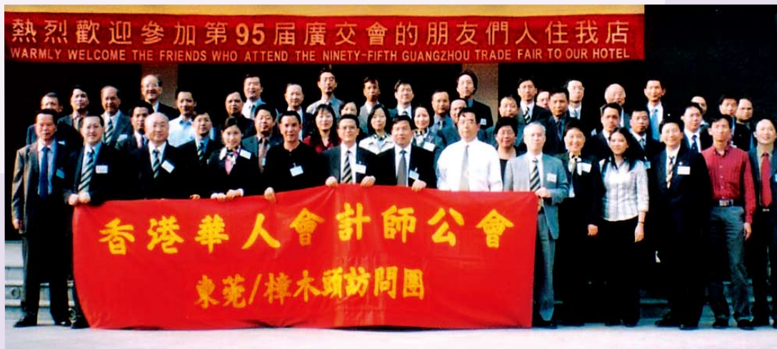
東莞市及樟木頭交流團