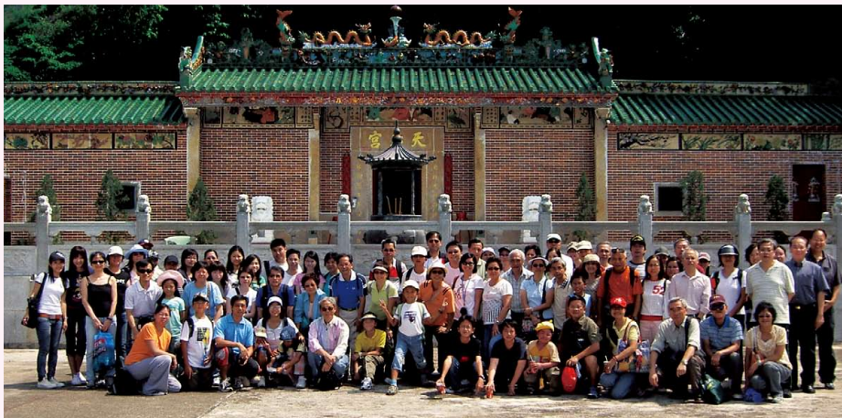
會員及家屬康樂活動 - 糧船灣一日遊