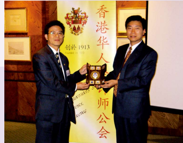
廣東省投資促進中心到訪