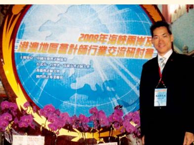
會計師行業交流研討會