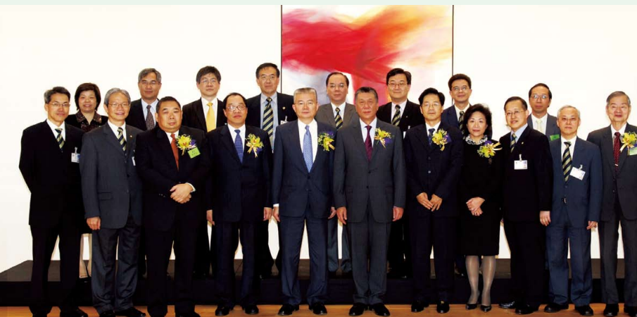
出席澳門會計專業聯會成立典禮與澳門特首何厚錕及主要官員合照