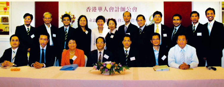
2008年立法會功能界別(會計界)選舉論壇