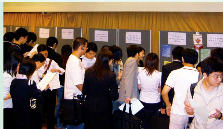
大學畢業生招聘會