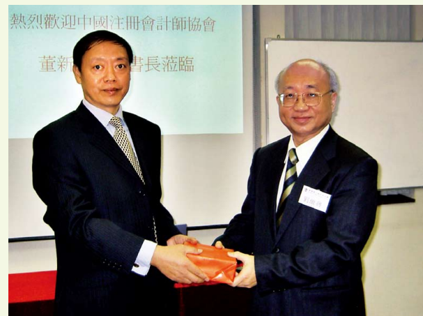
中國註冊會計師協會董新鋼副秘書長到訪