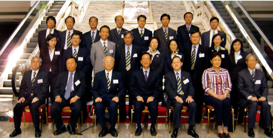
訪京團拜訪國家稅務總局