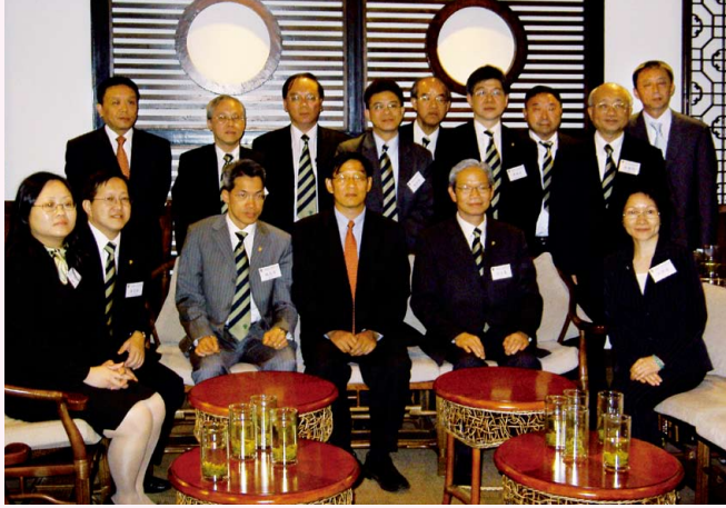
訪京團拜訪港澳辦與錢力軍司令長合照