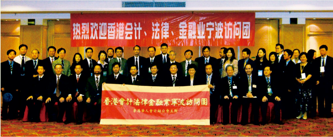
會友參加香港會計、法律、金融業寧波訪問團