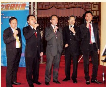
海峽兩岸及港澳會計師行業交流會