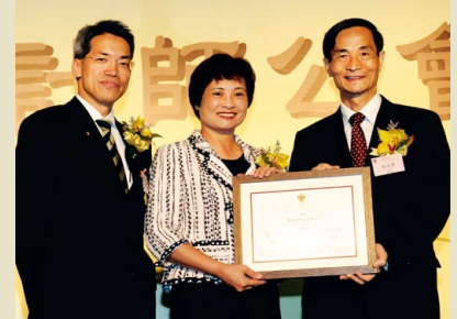
稅務局劉麥懿明局長