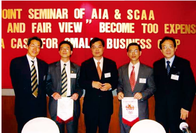
與國際會計師公會合辦研討會