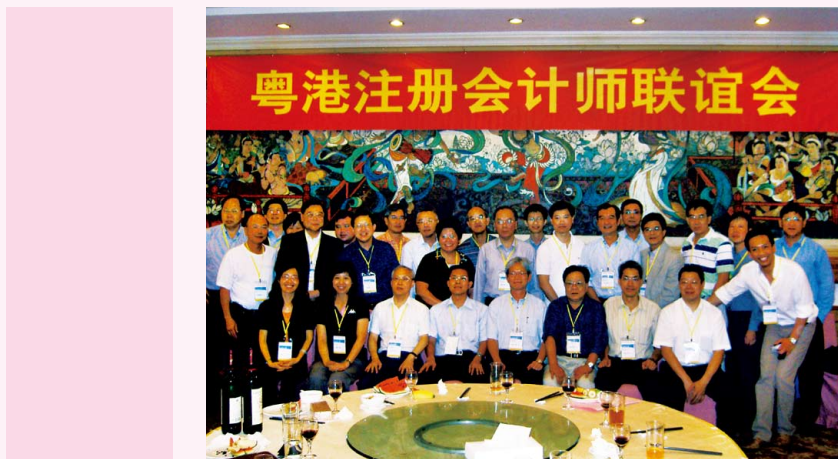
粵港註冊會計師交流