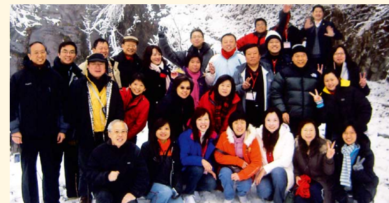
香港會計界秘書人員湖水觀光團