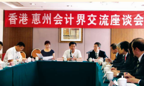
惠州會計師事務交流團