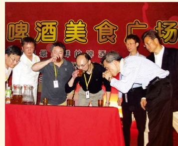
參觀啤酒廠及啤酒比賽