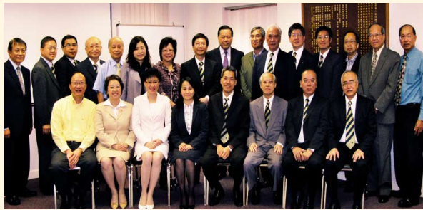
告別舊會址拍照留念及聚會