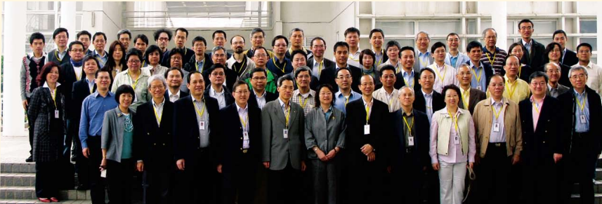
在深圳舉辦之「香港會計界國家事務研習課程」