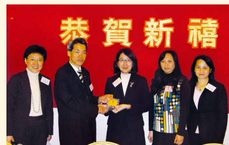
公司註冊處鍾麗玲處長出席午餐例會