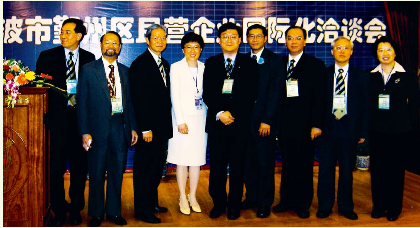
出席寧波市鄞州區民營企業國際化洽談會