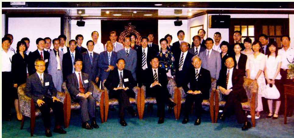
會員參觀入境事務處“E通道”後與黎棟國處長合照