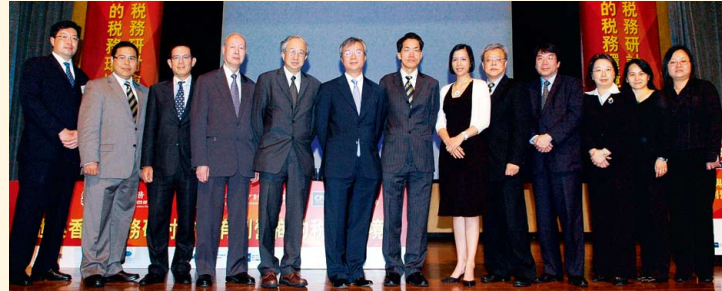
本會合辦之「有利營商的稅務環境」