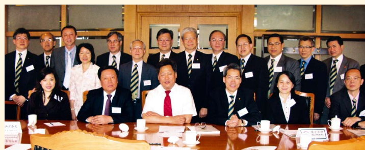
北京交流團拜訪國家財政部