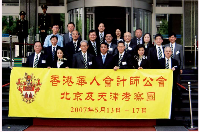
訪京團拜訪國家審計署與劉家義副審計長合照