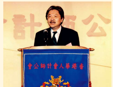
九十五週年慶祝晚會