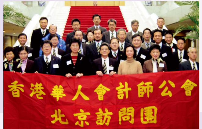
訪京團拜訪國家稅務總局