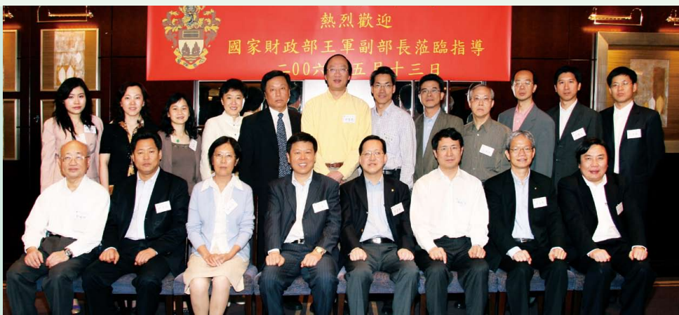
國家財政部王軍副部長蒞臨指導