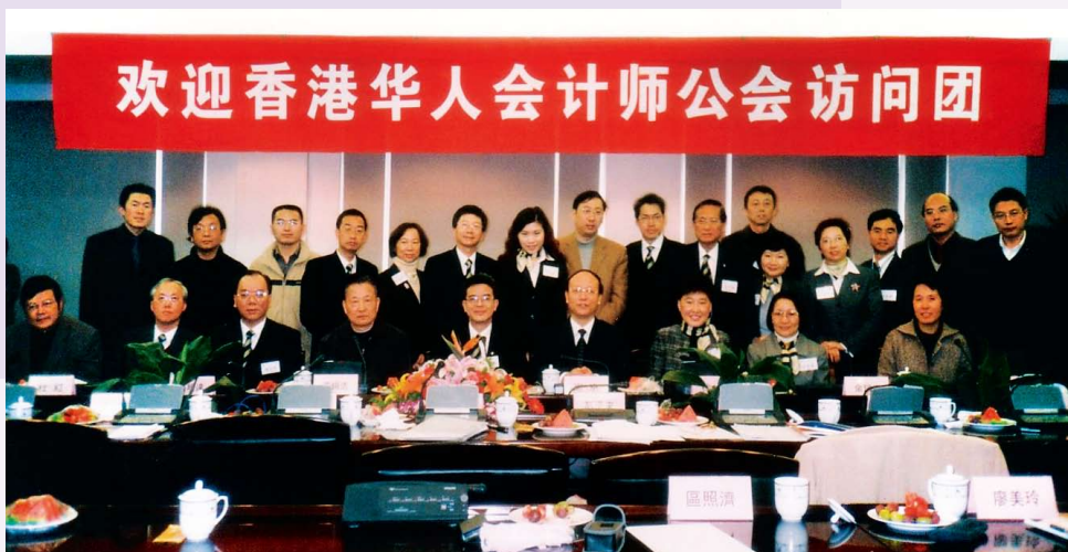
江蘇省南京交流團 - 拜訪江蘇省註冊會計師協會