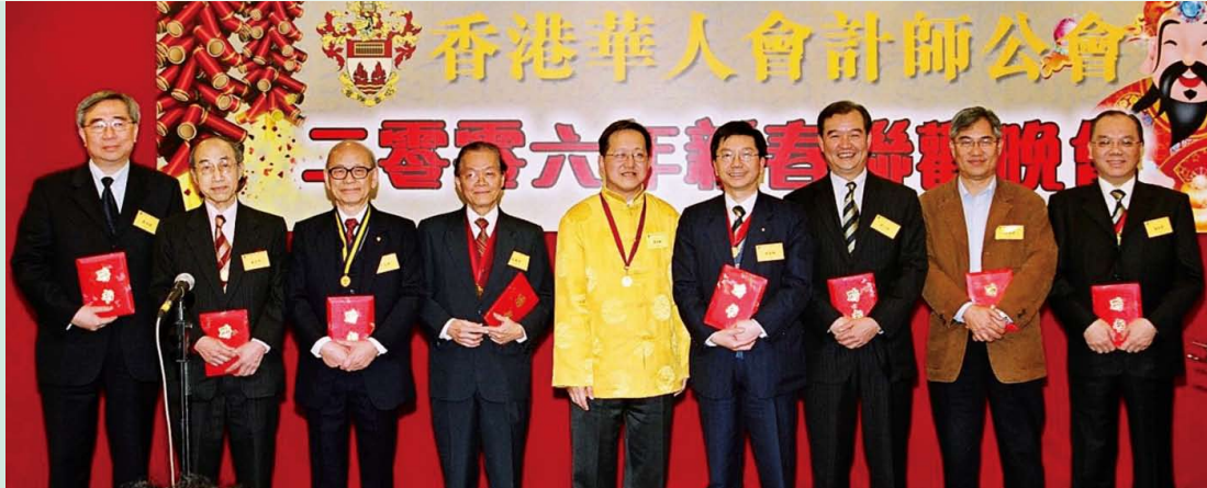
春茗聯歡 - 頒發顧問委員會聘書