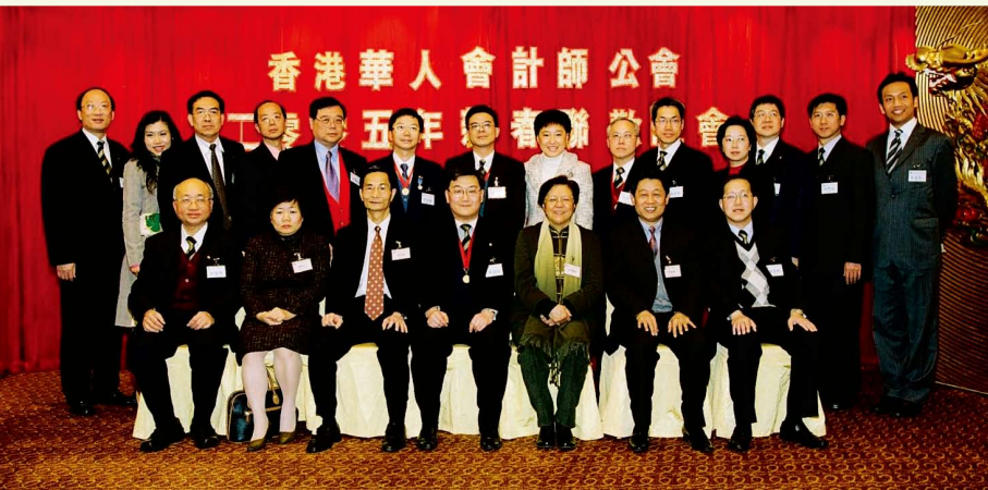
春茗嘉賓及理事合照