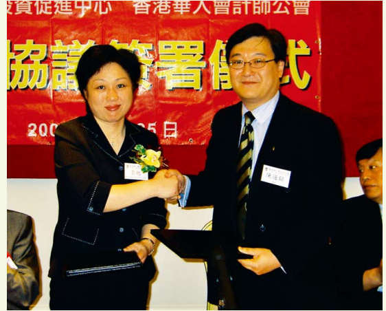
與廣州國際投資促進中心簽訂合作協議