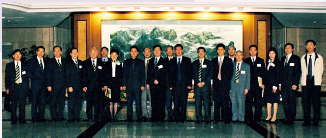
到訪深圳地方稅務局