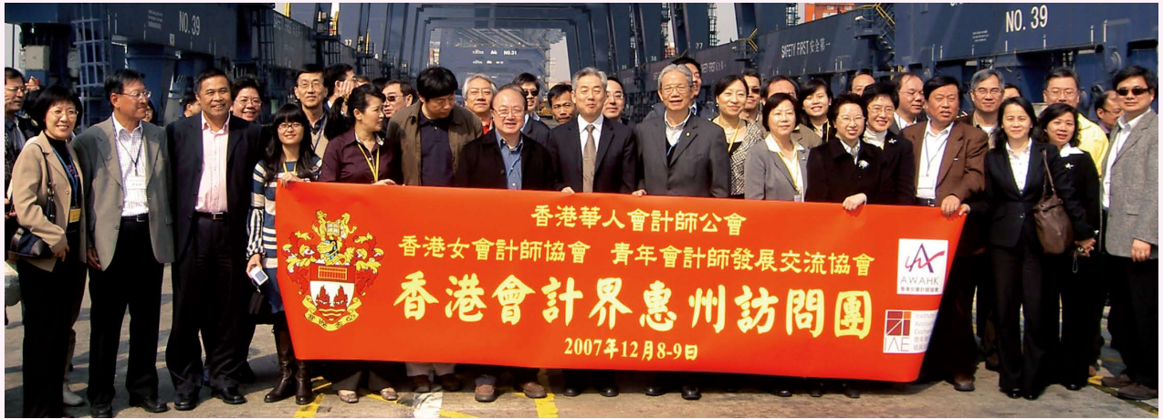
參觀鹽田港貨櫃碼頭