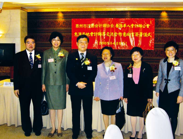
與惠州註冊會計師協會簽訂兩地交流合作意向書