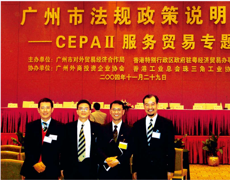
會長及會友出席廣州 CEPA II 服務貿易專題說明會