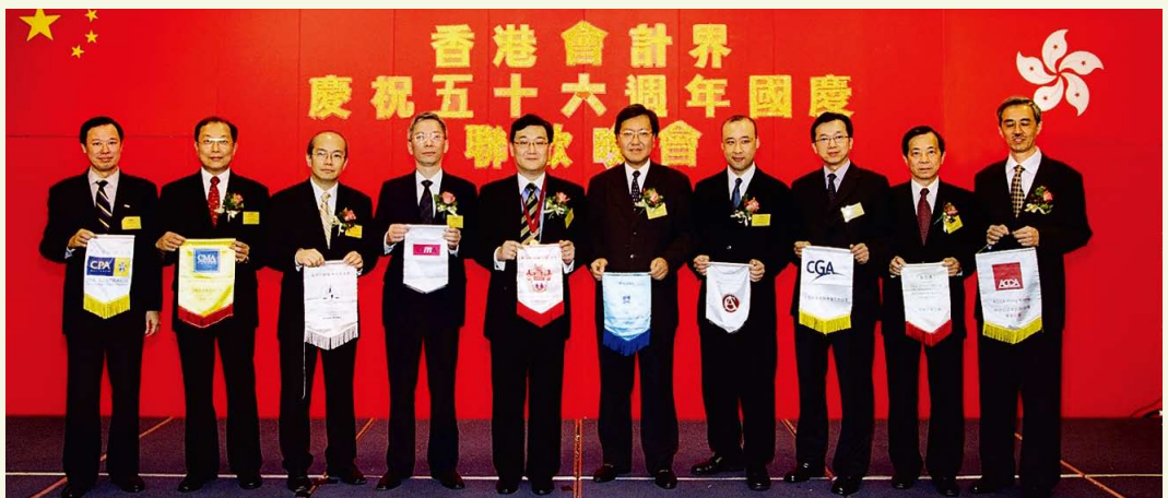
本會與9個會計專業團體合辦國慶聯歡晚會